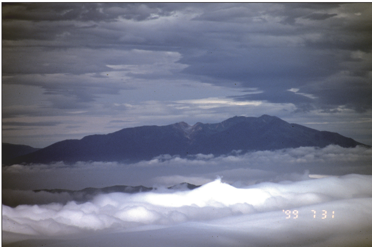
ベルタルベ山全景 南西側の国後島(爺爺岳南山腹)から 1999年7月31日