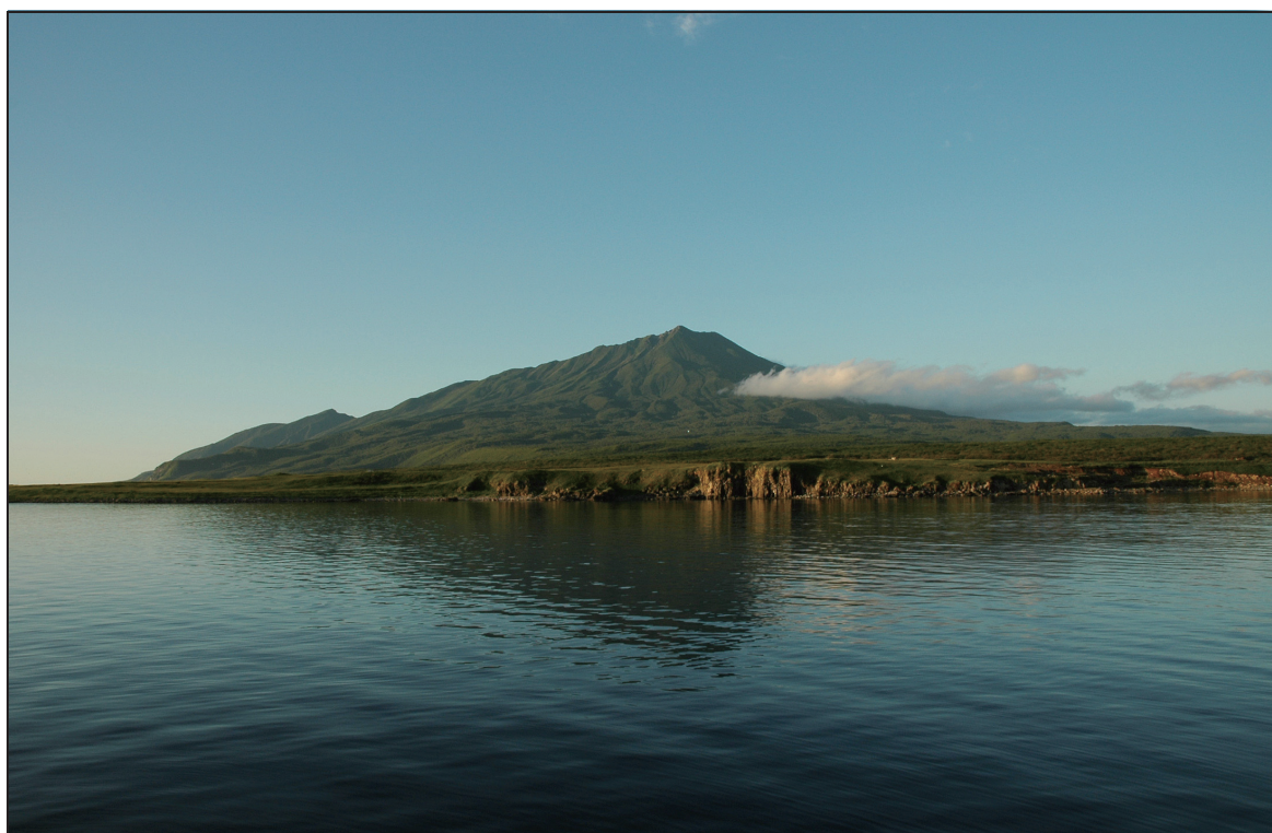
中央が散布山、左奥が北散布山 南南西側から 2005年8月28日