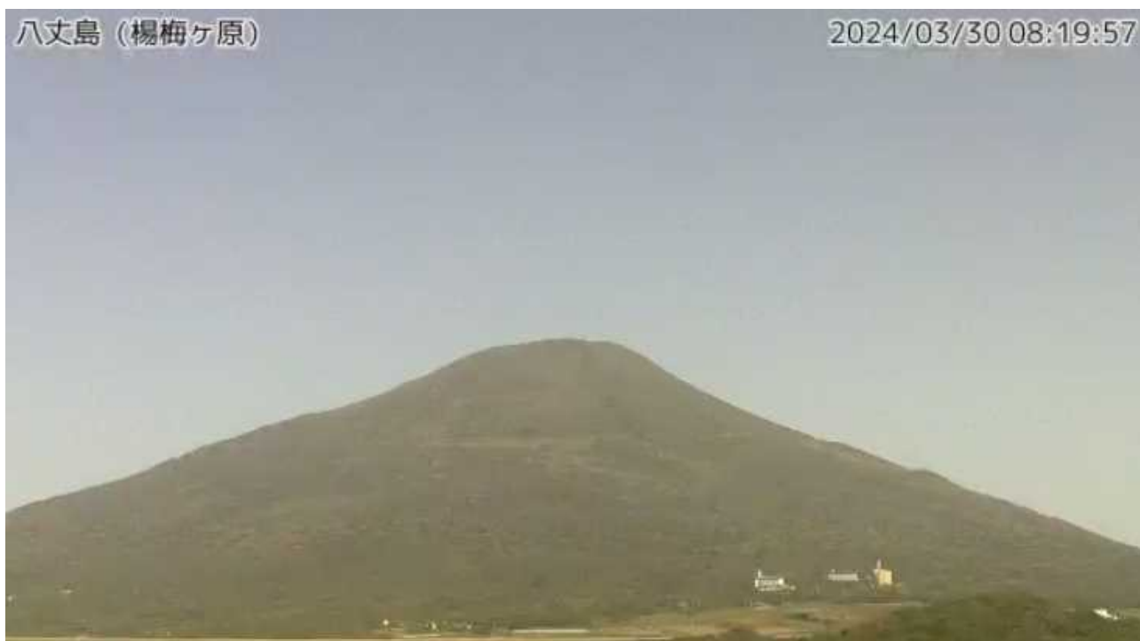
図1 八丈島 西山山頂部の状況（3月30日、楊梅ヶ原 ようめがはら 監視カメラによる）