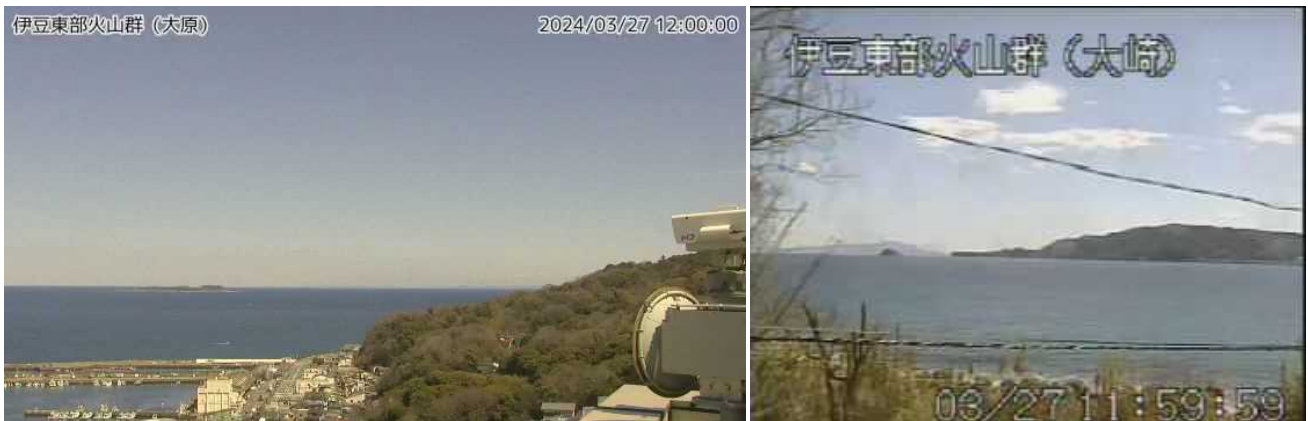
左図：大原監視カメラ（3月27日） 右図：大崎監視カメラ（3月27日）