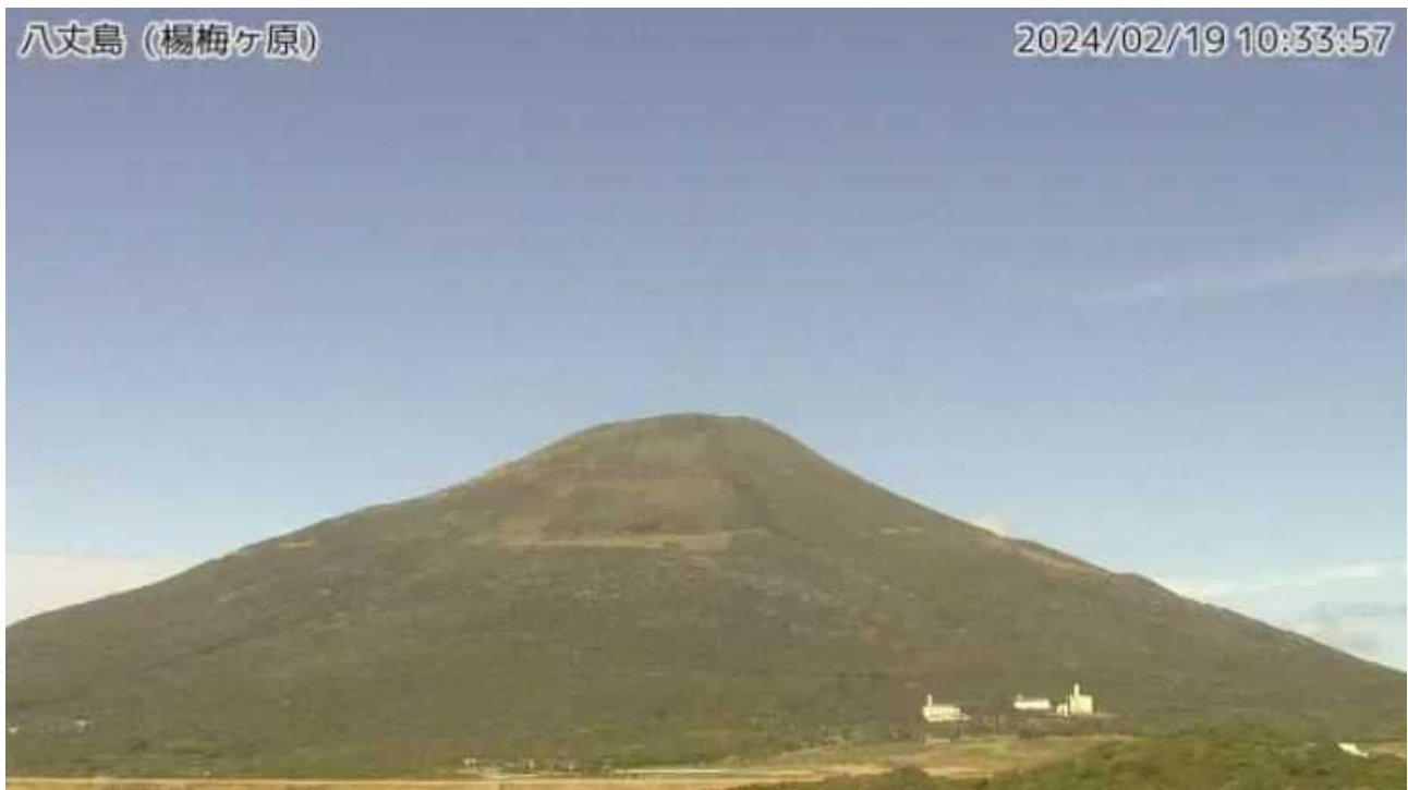
図1 八丈島 西山山頂部の状況（2月19日、楊梅ヶ原 ようめがはら 監視カメラによる）