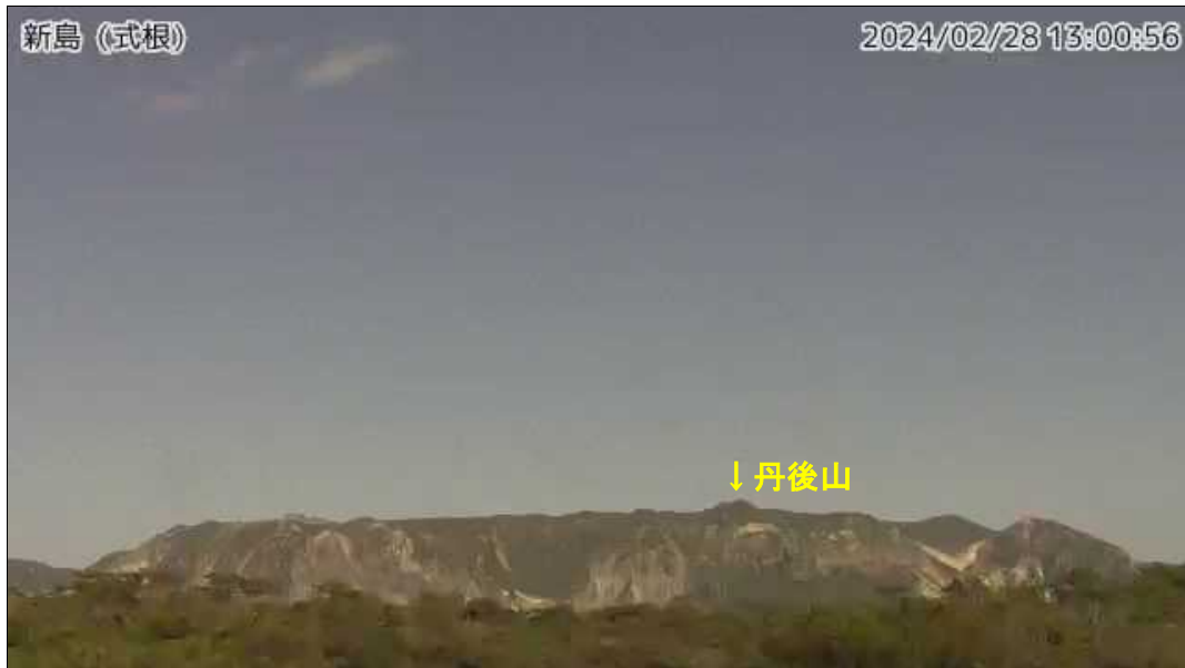
図1 新島 丹後山周辺の状況 (2月28日、式根監視カメラによる)