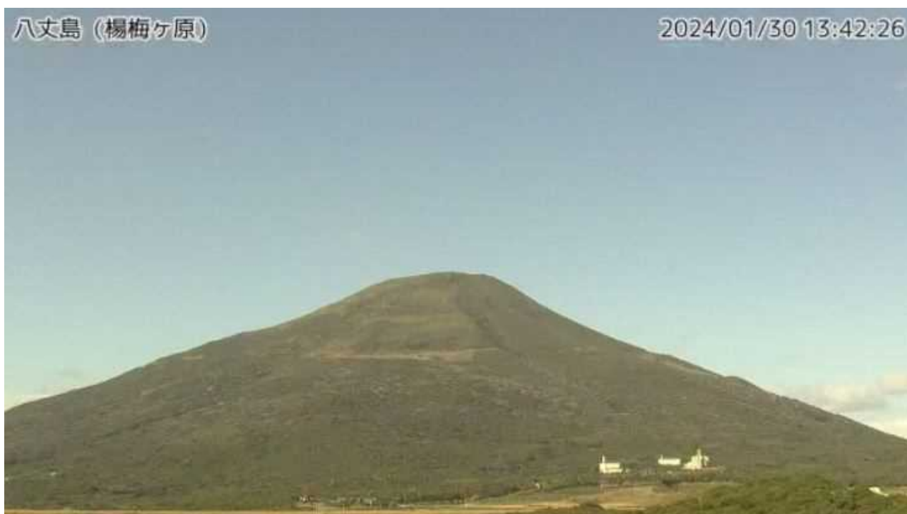
図1 八丈島 西山山頂部の状況（1月30日、楊梅ヶ原 ようめがはら 監視カメラによる）