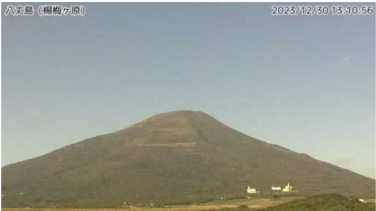
図1 八丈島 西山山頂部の状況（12月30日、楊梅ヶ原 ようめがはら 監視カメラによる）