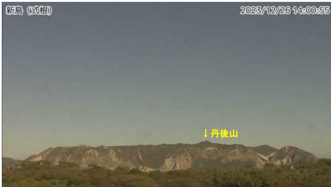
図1 新島 丹後山周辺の状況 (12月26日、式根監視カメラによる)