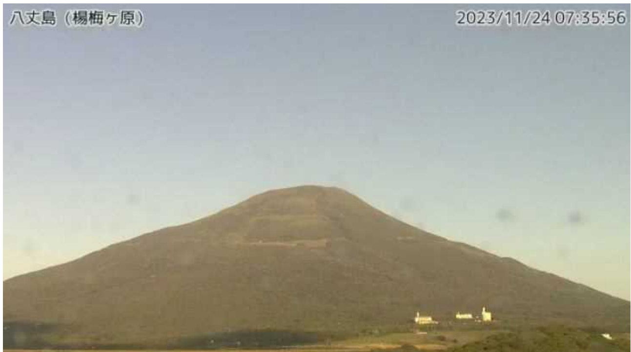
図1 八丈島 西山山頂部の状況（11月24日、楊梅ヶ原 ようめがはら 監視カメラによる）