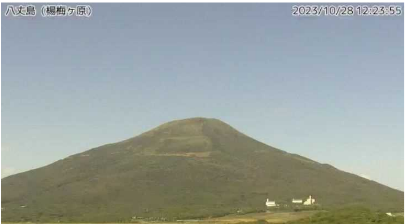
図1 八丈島 西山山頂部の状況（10月28日、楊梅ヶ原 ようめがはら 監視カメラによる）