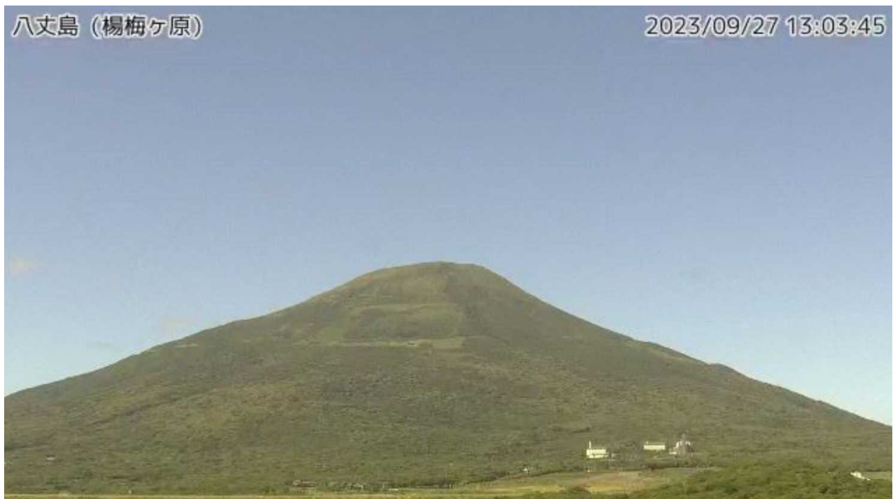
図1 八丈島 西山山頂部の状況（9月27日、楊梅ヶ原 ようめがはら 監視カメラによる）