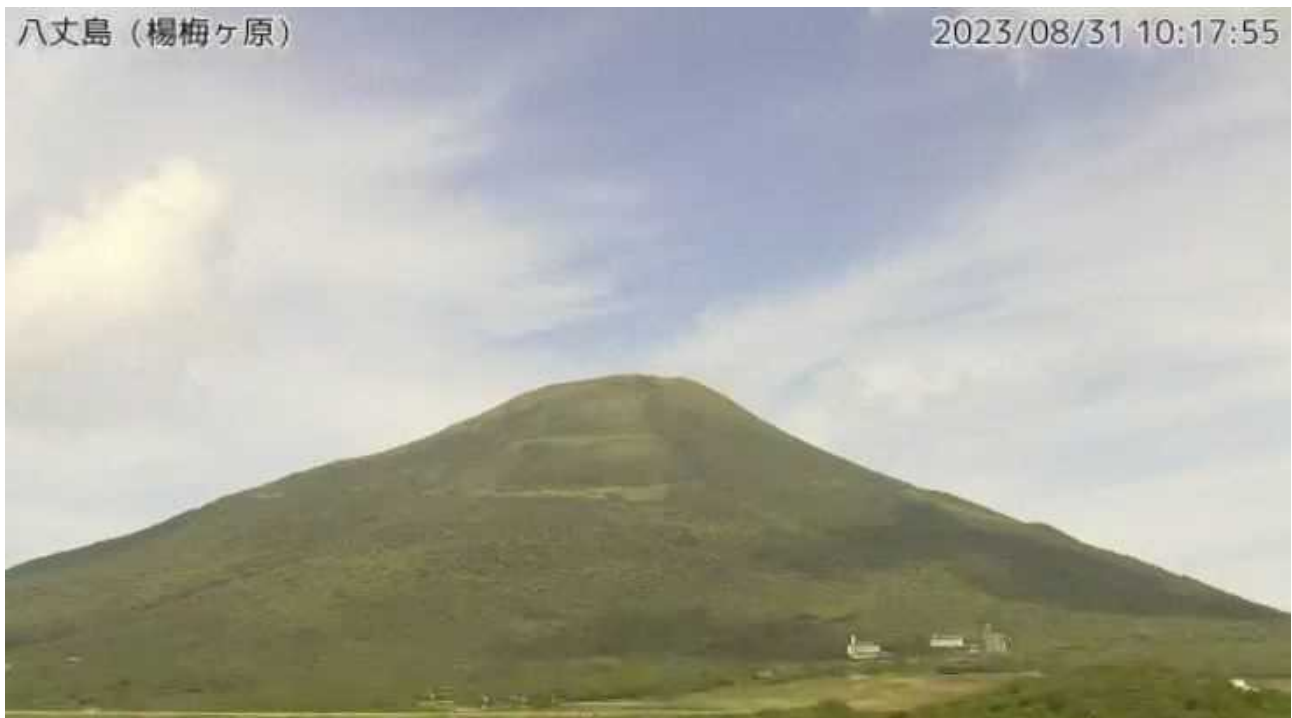
図1 八丈島 西山山頂部の状況（8月31日、楊梅ヶ原 ようめがはら 監視カメラによる）