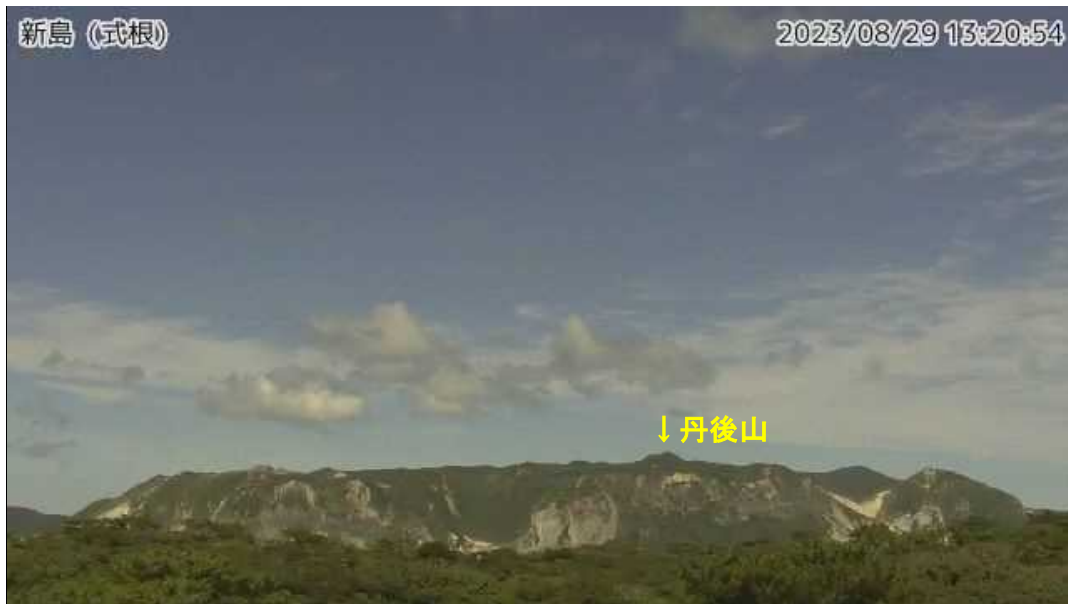
図1 新島 丹後山周辺の状況 (8月29日、式根監視カメラによる)