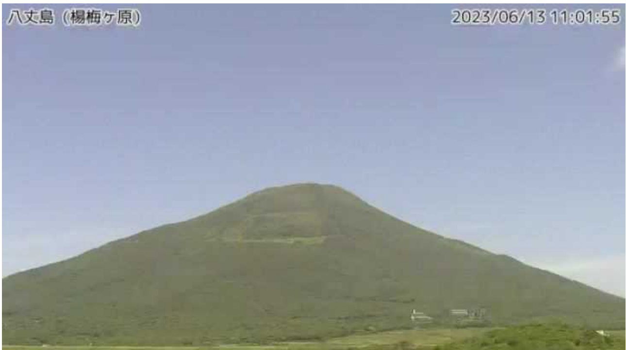
図1 八丈島 西山山頂部の状況（6月13日、楊梅ヶ原 ようめがはら 監視カメラによる）