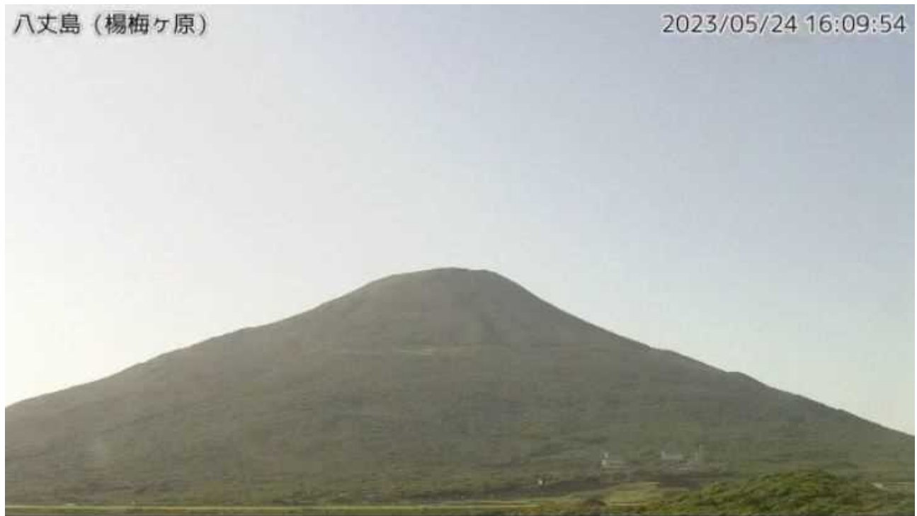
図1 八丈島 西山山頂部の状況（5月24日、楊梅ヶ原 ようめがはら 監視カメラによる）