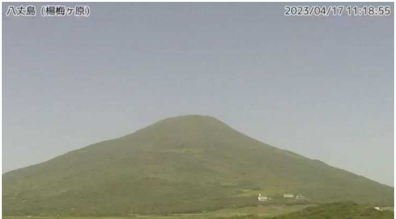
図1 八丈島 西山山頂部の状況（4月17日、楊梅ヶ原 ようめがはら 監視カメラによる）