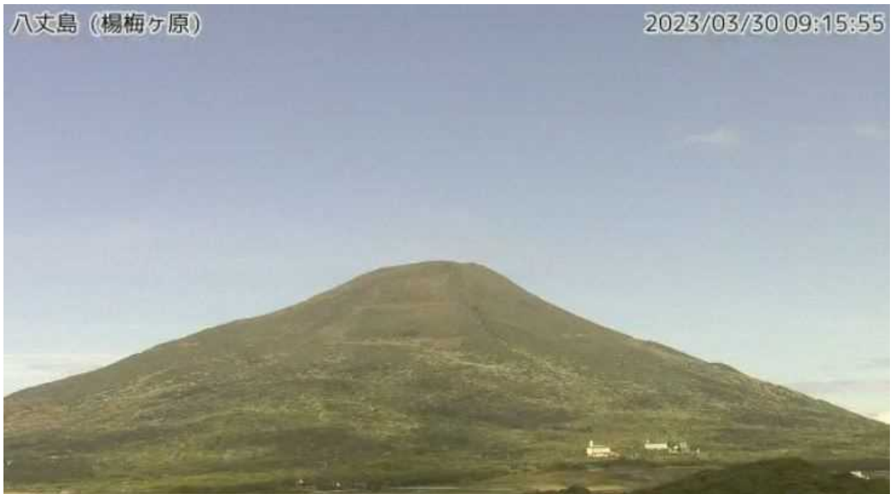
図1 八丈島 西山山頂部の状況（3月30日、楊梅ヶ原 ようめがはら 監視カメラによる）