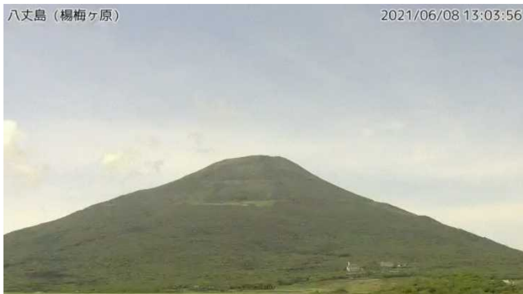
図1 八丈島 西山山頂部の状況（6月8日、楊梅ヶ原監視カメラによる）

GNSS連続観測及び傾斜計による観測では、火山活動によるとみられる変動は認められません。