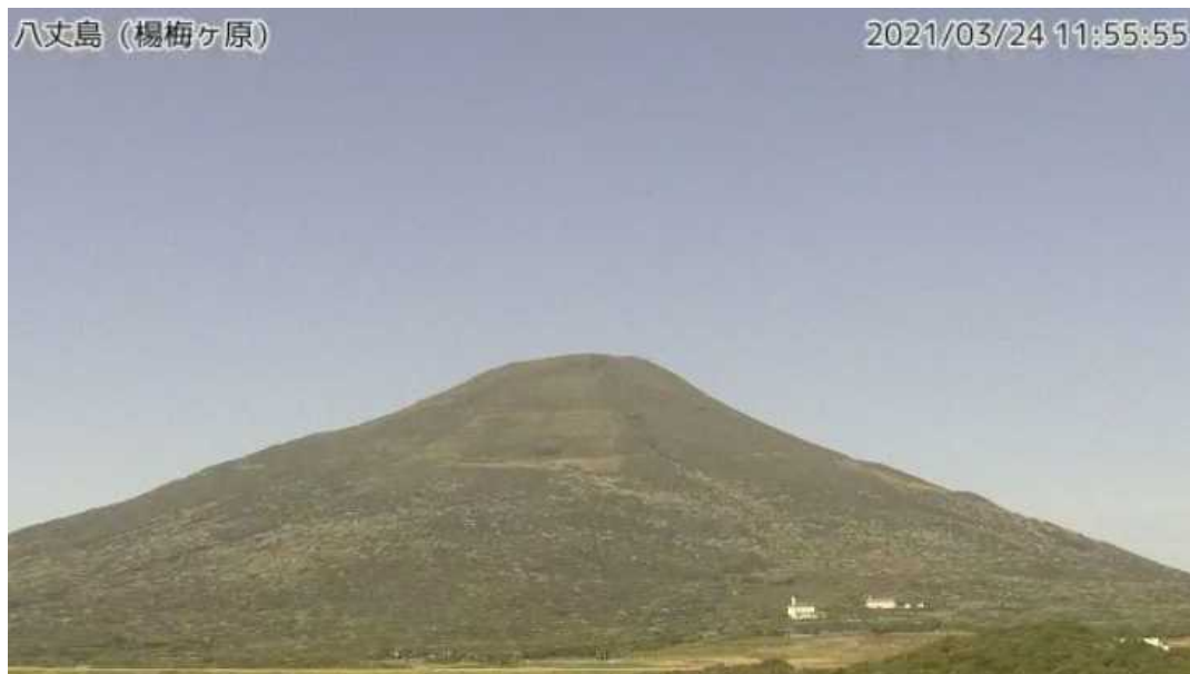
図1 八丈島 西山山頂部の状況（3月24日、楊梅ヶ原 ようめがはら 監視カメラによる）

GNSS連続観測及び傾斜計による観測では、火山活動によるとみられる変動は認められません。