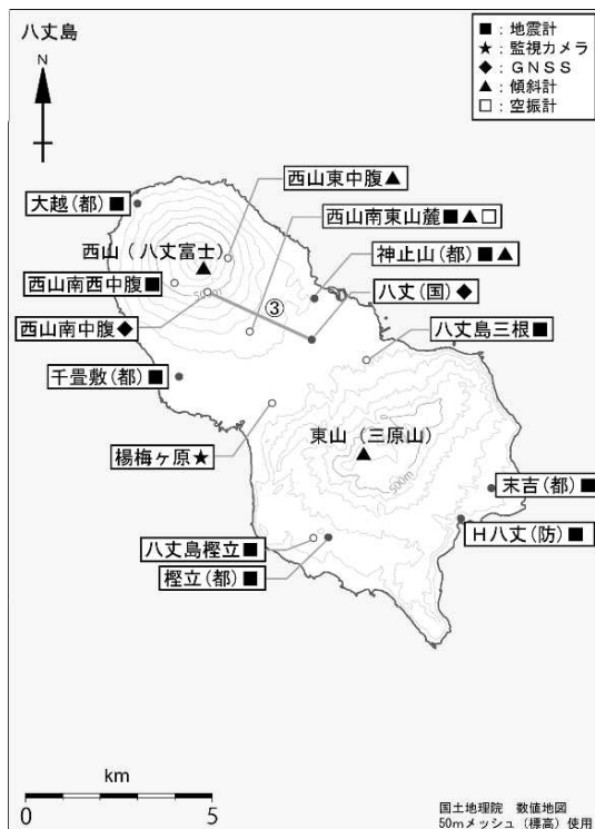
図4 八丈島 観測点配置図 GNSS 基線③は図2の③に対応しています。 小さな白丸(○)は気象庁、小さな黒丸(●)は気象庁以外の機関の観測点位置を示しています。 (国): 国土地理院 (防): 防災科学技術研究所 (都): 東京都