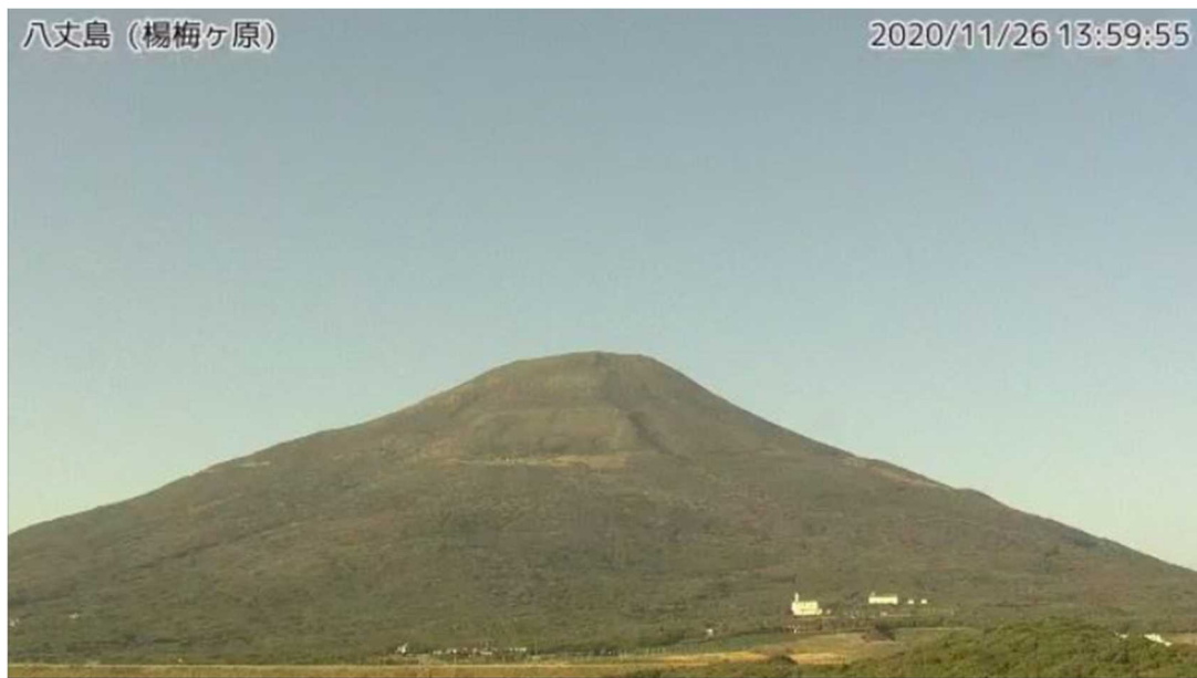
図1 八丈島 西山山頂部の状況 (11月26日、楊梅ヶ原 ようめがはら 監視カメラによる)

この火山活動解説資料は気象庁ホームページ（ https://www.data.jma.go.jp/svd/vois/data/tokyo/STOCK/monthly_v-act_doc/monthly_vact.php ）でも閲覧できます。