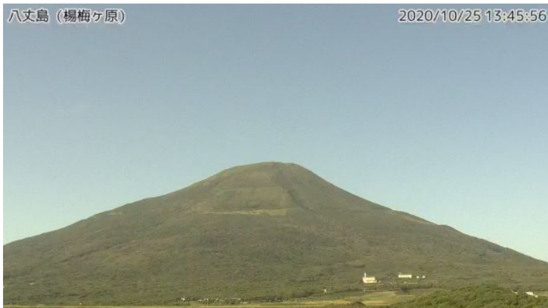
図1 八丈島 西山山頂部の状況 (10月25日、楊梅ヶ原 ようめがはら 監視カメラによる)

この火山活動解説資料は気象庁ホームページ（ https://www.data.jma.go.jp/svd/vois/data/tokyo/STOCK/monthly_v-act_doc/monthly_vact.php ）でも閲覧できます。