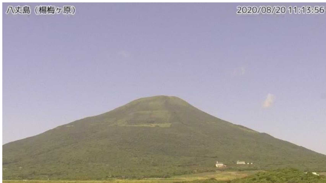
図1 八丈島 西山山頂部の状況 (8月20日、楊梅ヶ原 ようめがはら 監視カメラによる)

この火山活動解説資料は気象庁ホームページ ( https://www.data.jma.go.jp/svd/vois/data/tokyo/STOCK/monthly_v-act_doc/monthly_vact.php ) でも閲覧できます。