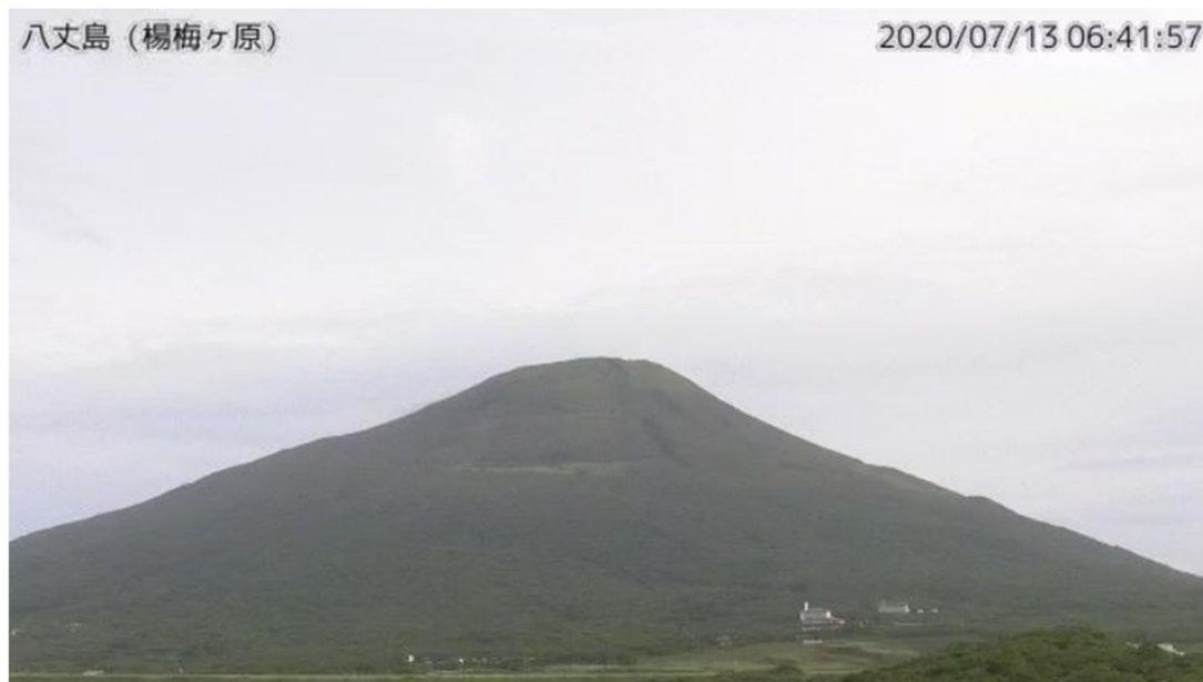
図1 八丈島 西山山頂部の状況 (7月13日、楊梅ヶ原 ようめがはら 監視カメラによる)

この火山活動解説資料は気象庁ホームページ ( https://www.data.jma.go.jp/svd/vois/data/tokyo/STOCK/monthly_v-act_doc/monthly_vact.php ) でも閲覧できます。