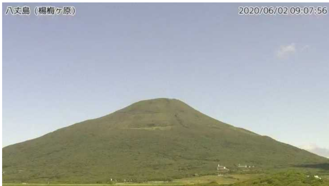
図1 八丈島 西山山頂部の状況 （6月2日、楊梅ヶ原 ようめがはら 監視カメラによる）

この火山活動解説資料は気象庁ホームページ（ https://www.data.jma.go.jp/svd/vois/data/tokyo/STOCK/monthly_v-act_doc/monthly_vact.php ）でも閲覧できます。