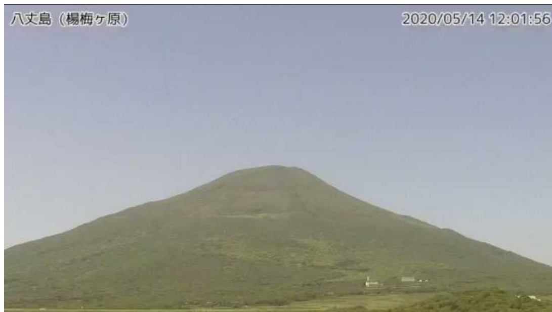
図1 八丈島 西山山頂部の状況 （5月14日、楊梅ヶ原 ようめがはら 監視カメラによる）

この火山活動解説資料は気象庁ホームページ（ https://www.data.jma.go.jp/svd/vois/data/tokyo/STOCK/monthly_v-act_doc/monthly_vact.php ）でも閲覧できます。