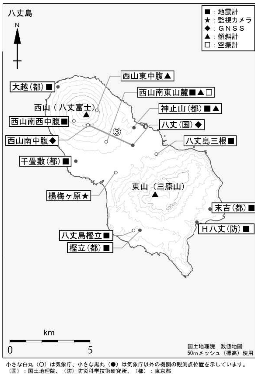
図4 八丈島 観測点配置図 GNSS基線 は図2の に対応しています。