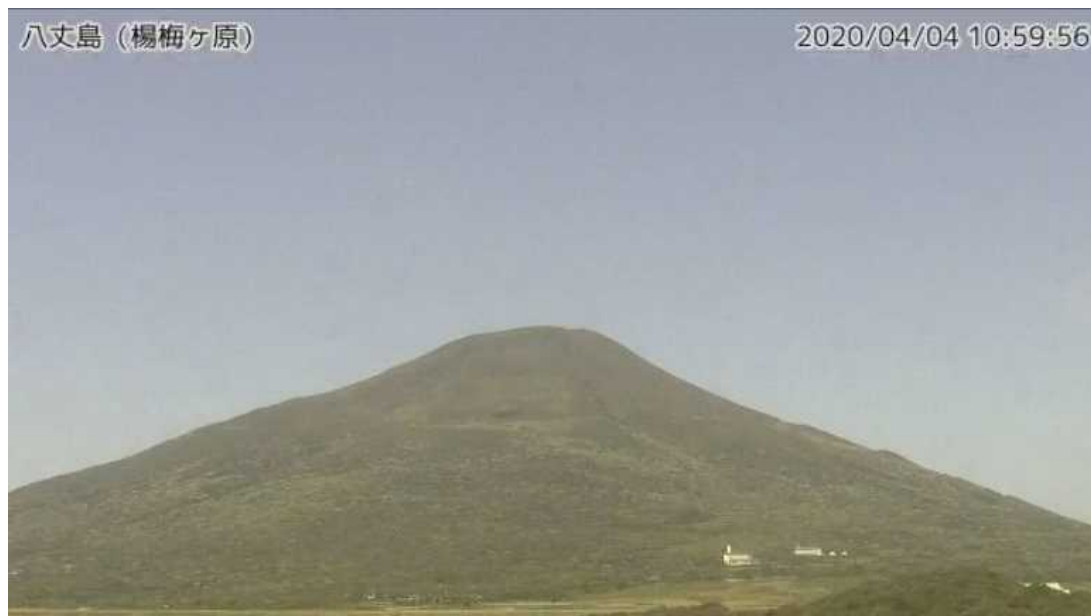
図1 八丈島 西山山頂部の状況 （4月4日、楊梅ヶ原 ようめがはら 監視カメラによる）

この火山活動解説資料は気象庁ホームページ（ https://www.data.jma.go.jp/svd/vois/data/tokyo/STOCK/monthly_v-act_doc/monthly_vact.php ）でも閲覧できます。