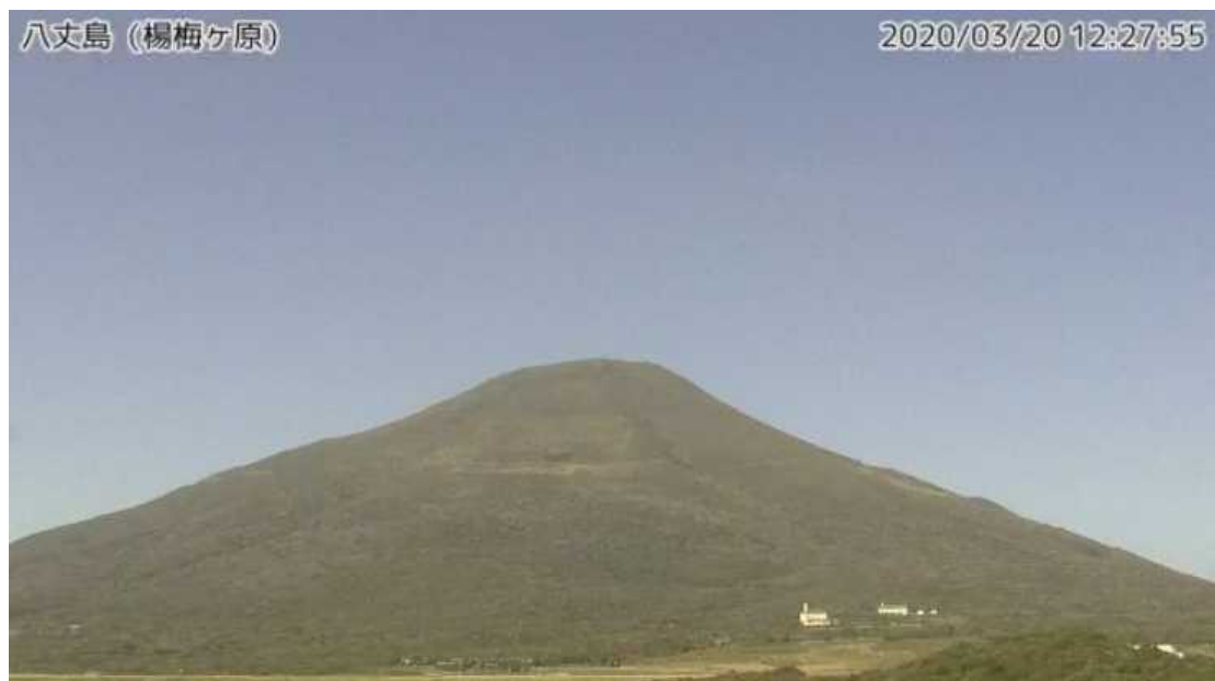
図1 八丈島 西山山頂部の状況 （3月20日、楊梅ヶ原 ようめがはら 監視カメラによる）

この火山活動解説資料は気象庁ホームページ（ https://www.data.jma.go.jp/svd/vois/data/tokyo/STOCK/monthly_v-act_doc/monthly_vact.php ）でも閲覧できます。