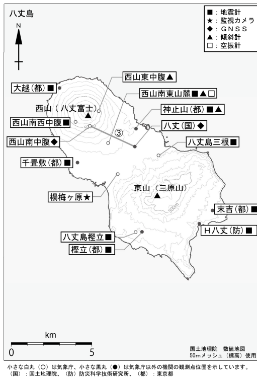
図4 八丈島 観測点配置図 GNSS基線は図2のに対応しています。 小さな白丸(○)は気象庁、小さな黒丸(●)は気象庁以外の機関の観測点位置を示しています。 (国): 国土地理院 (防): 防災科学技術研究所 (都): 東京都