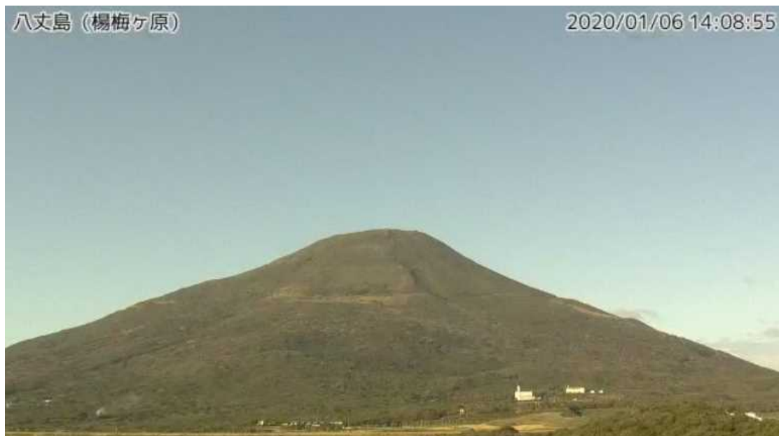
図1 八丈島 西山山頂部の状況 (1月6日、楊梅ヶ原 ようめがはら 監視カメラによる)

この火山活動解説資料は気象庁ホームページ（ https://www.data.jma.go.jp/svd/vois/data/tokyo/STOCK/monthly_v-act_doc/monthly_vact.php ）でも閲覧できます。