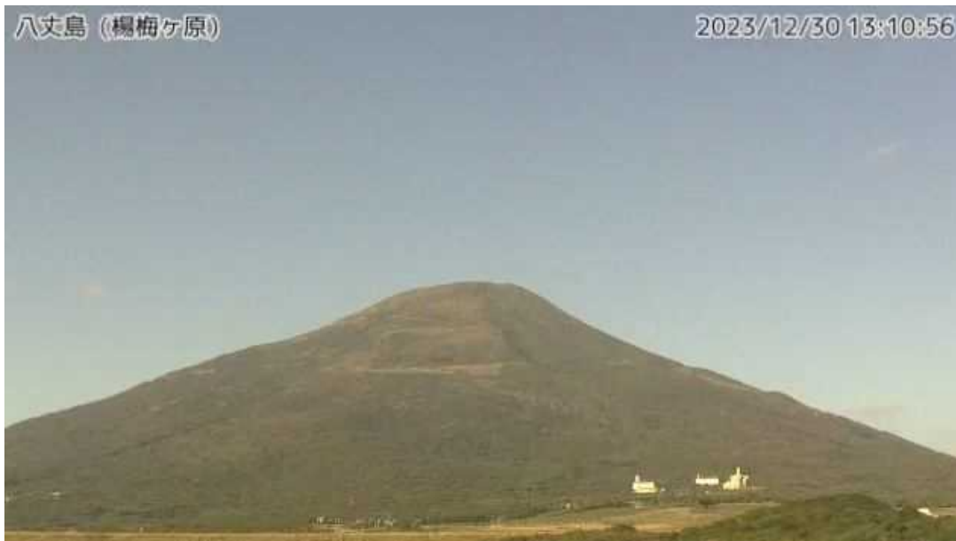
図1 八丈島 山頂部の状況 (12月30日 楊梅ヶ原監視カメラによる)