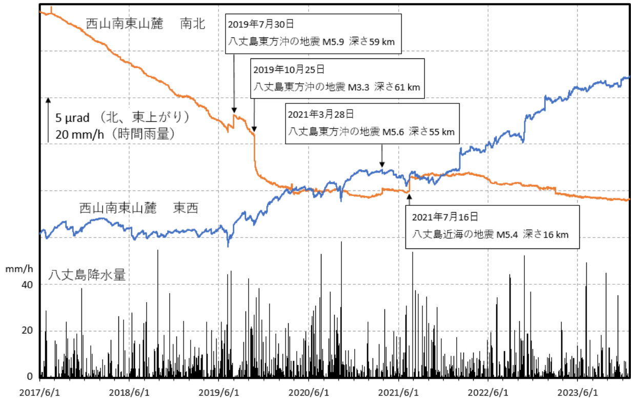
図4 八丈島 西山南東山麓観測点の傾斜変動（2017年6月1日～2023年12月31日）