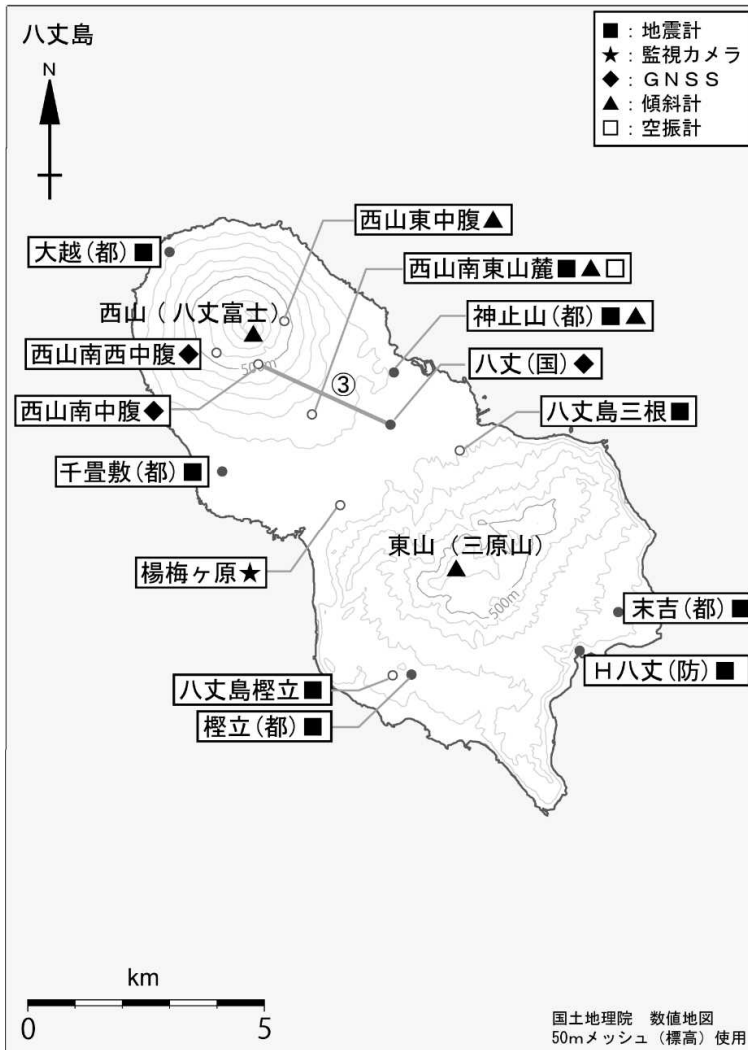
図5 八丈島 観測点配置図

GNSS 基線③は図2の③に対応しています。 小さな白丸(○)は気象庁、小さな黒丸(●)は気象庁以外の機関の観測点位置を示しています。