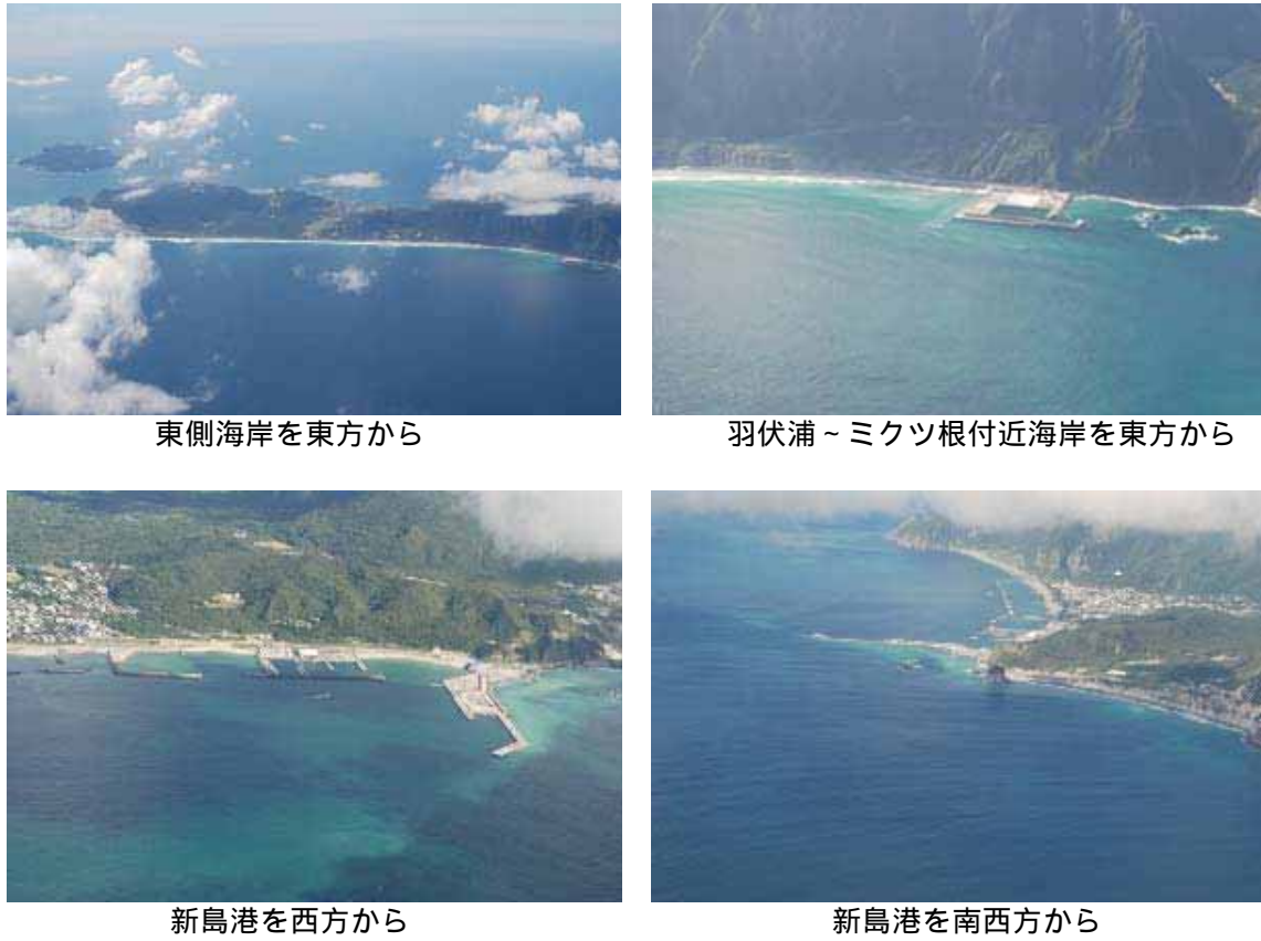
図 2 新島周辺の状況（8月26日）