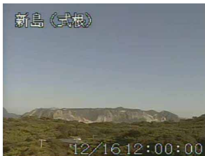
図 1 新島 丹後山山頂部の状況（12 月 16 日、式根遠望カメラによる）

この資料は気象庁ホームページ（ http://www.seisvol.kishou.go.jp/tokyo/volcano.html ）でも閲覧することができます。