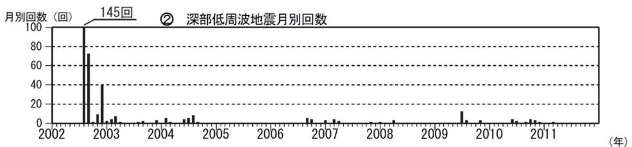
図 2※ 八丈島 月別地震回数(2002 年 1 月～2011 年 12 月)、波形例は図 3 参照