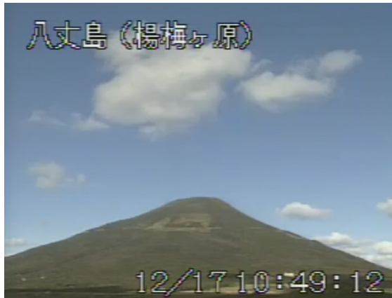
図 1 八丈島 山頂部の状況 (12月17日 楊梅ヶ原遠望カメラによる)