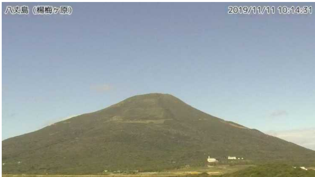
図 1 八丈島 西山山頂部の状況 (11月11日、楊梅ヶ原 ようめがはら 監視カメラによる)

この火山活動解説資料は気象庁ホームページ（ https://www.data.jma.go.jp/svd/vois/data/tokyo/STOCK/monthly_v-act_doc/monthly_vact.php ）でも閲覧できます。