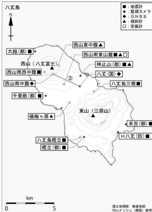
図3 八丈島 観測点配置図

GNSS基線 は図2の に対応しています。 小さな白丸(○)は気象庁、小さな黒丸(●)は気象庁以外の機関の観測点位置を示しています。 (国): 国土地理院 (防): 防災科学技術研究所 (都): 東京都