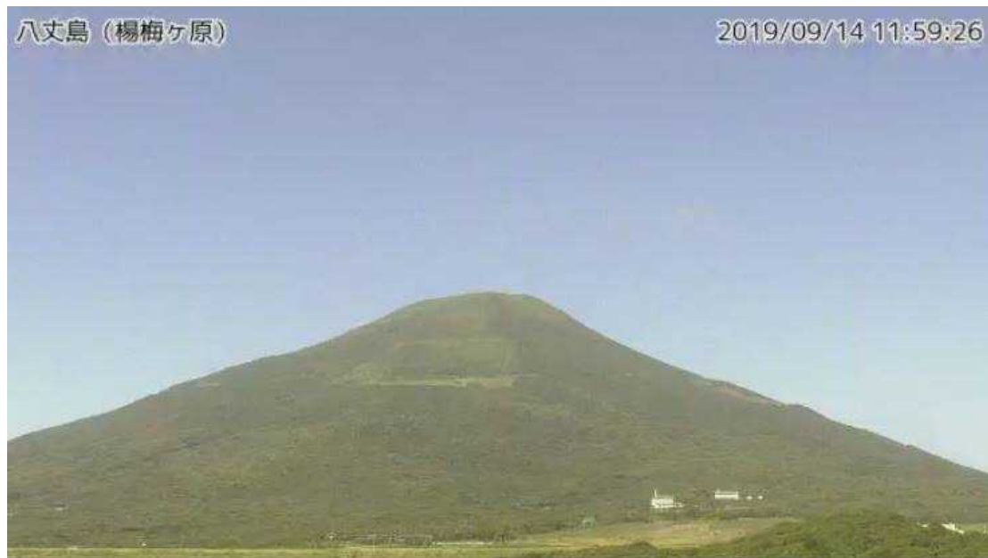
図1 八丈島 西山山頂部の状況 (9月14日、楊梅ヶ原 ようめがはら 監視カメラによる)

この火山活動解説資料は気象庁ホームページ（ https://www.data.jma.go.jp/svd/vois/data/tokyo/STOCK/monthly_v-act_doc/monthly_vact.php ）でも閲覧できます。