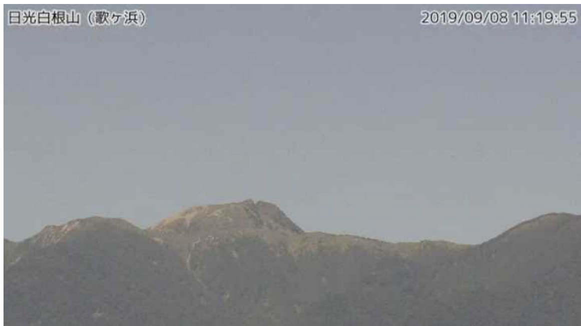
図1 日光白根山 山頂部の状況（9月8日 歌ヶ浜 うたがはま 監視カメラによる）

この火山活動解説資料は気象庁ホームページ（ https://www.data.jma.go.jp/svd/vois/data/tokyo/STOCK/monthly_v-act_doc/monthly_vact.php ）でも閲覧することができます。