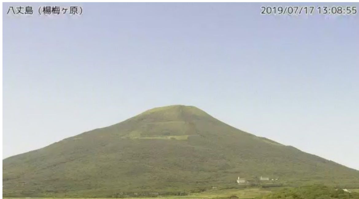
図1 八丈島 西山山頂部の状況 (7月17日、楊梅ヶ原 ようめがはら 監視カメラによる)

この火山活動解説資料は気象庁ホームページ ( https://www.data.jma.go.jp/svd/vois/data/tokyo/STOCK/monthly_v-act_doc/monthly_vact.php ) でも閲覧できます。