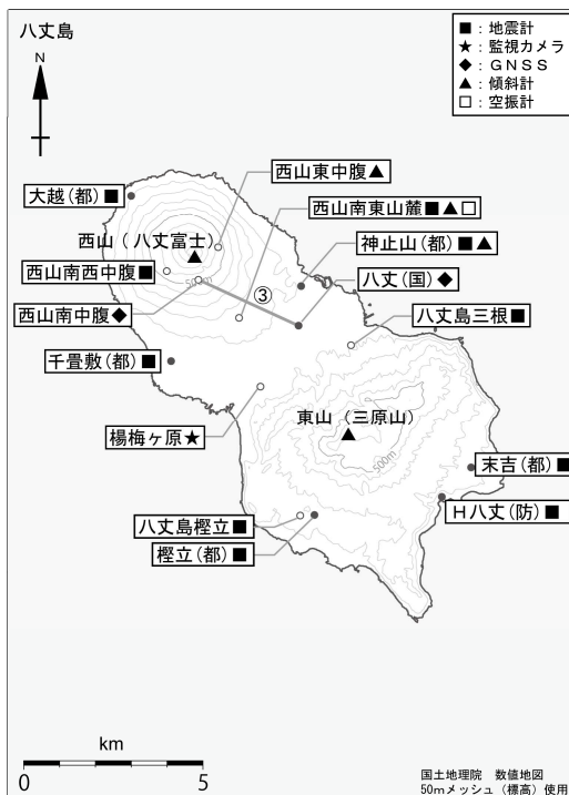
図3 八丈島 観測点配置図

GNSS基線③は図2の③に対応しています。 小さな白丸(○)は気象庁、小さな黒丸(●)は気象庁以外の機関の観測点位置を示しています。 (国)：国土地理院 (防)：防災科学技術研究所 (都)：東京都