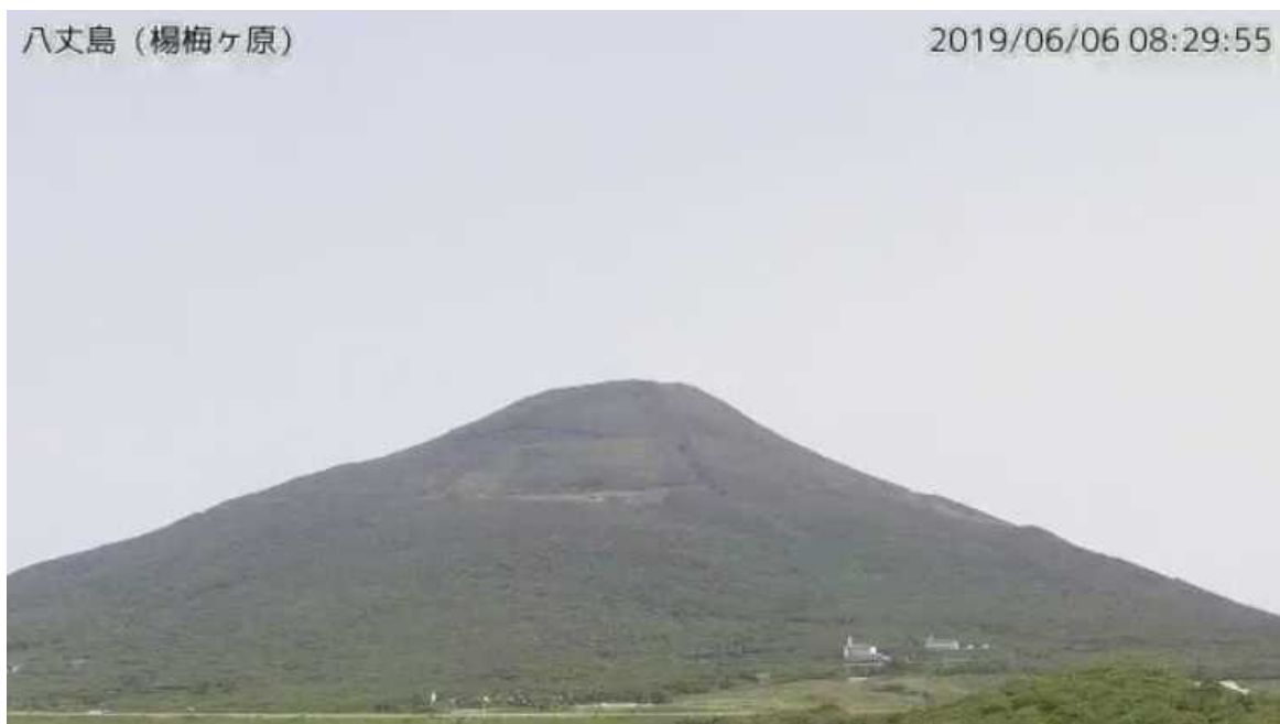
図1 八丈島 西山山頂部の状況 (6月6日、楊梅ヶ原 ようめがはら 監視カメラによる)

この火山活動解説資料は気象庁ホームページ ( https://www.data.jma.go.jp/svd/vois/data/tokyo/STOCK/monthly_v-act_doc/monthly_vact.php ) でも閲覧できます。