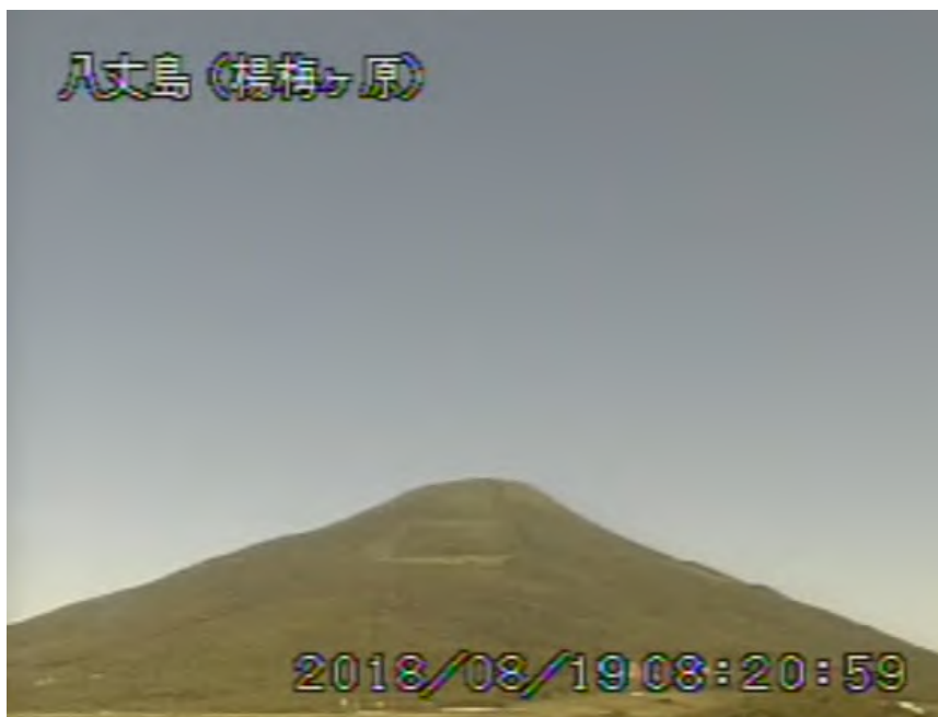
図 1 八丈島 西山山頂部の状況 ( 8 月 19 日、楊梅ヶ原 ようめがはら 監視カメラによる )

1) GNSS (Global Navigation Satellite Systems) とは、GPSをはじめとする衛星測位システム全般を示す呼称です。