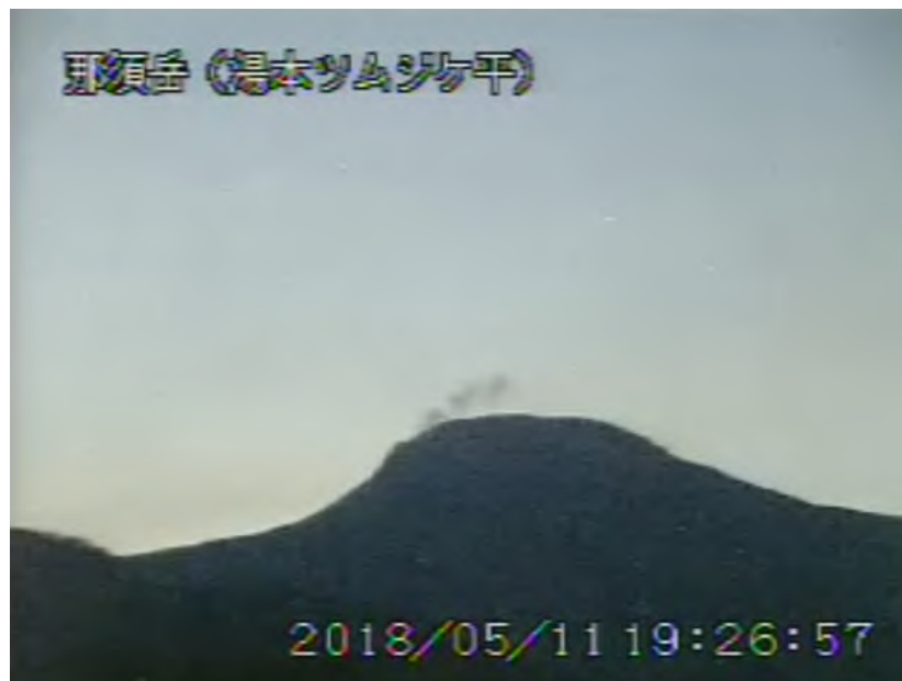
図 1 那須岳 茶臼岳の状況（5 月 11 日、湯本ツムジケ平監視カメラによる）

1) GNSS (Global Navigation Satellite Systems) とは、GPS をはじめとする衛星測位システム全般を示す呼称です。