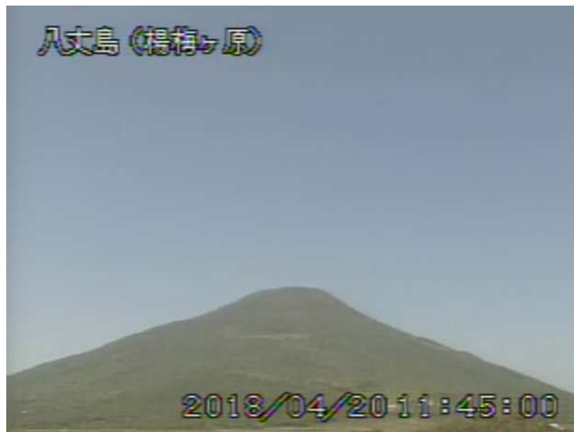
図 1 八丈島 西山山頂部の状況 (4月20日、楊梅ヶ原 ようめがはら 監視カメラによる)

1) GNSS (Global Navigation Satellite Systems) とは、GPSをはじめとする衛星測位システム全般を示す呼称です。