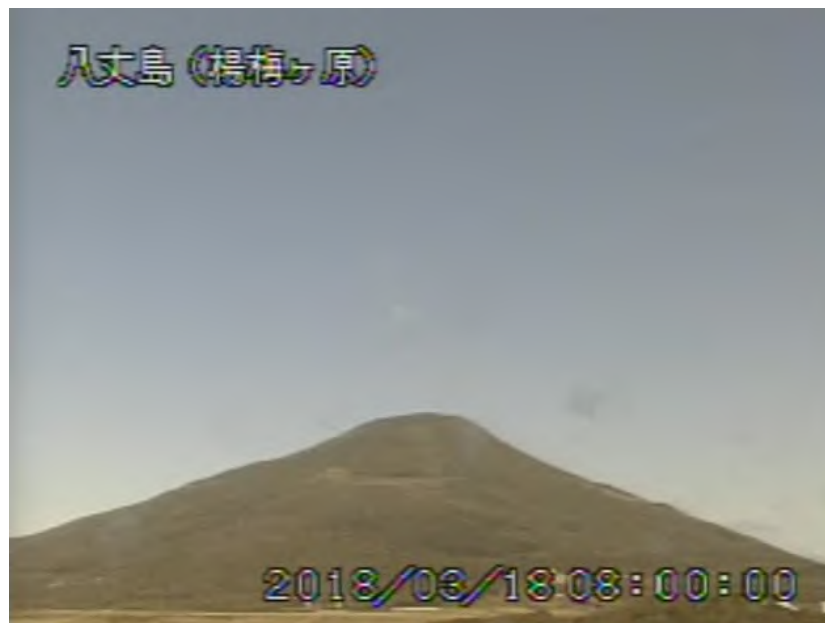
図 1 八丈島 西山山頂部の状況 (3月18日、楊梅ヶ原 ようめがはら 監視カメラによる)

1) GNSS (Global Navigation Satellite Systems) とは、GPSをはじめとする衛星測位システム全般を示す呼称です。