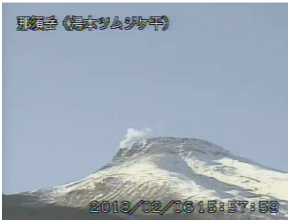
図 1 那須岳 茶臼岳の状況（2月6日、湯本ツムジケ平監視カメラによる）

1) 火山活動による山体の傾きを精密に観測する機器。火山体直下へのマグマの貫入等により変化が観測されることがあります。1 マイクロラジアンは 1 km 先が 1 mm 上下するような変化量です。