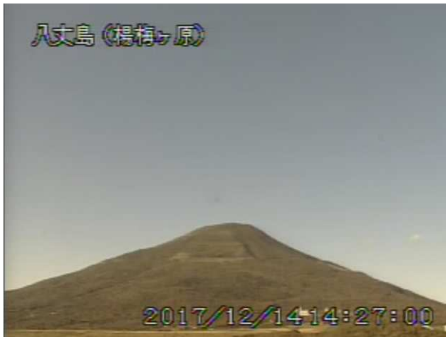
図 1 八丈島 西山山頂部の状況 (12月14日、楊梅ヶ原 ようめがはら 監視カメラによる)

1) GNSS (Global Navigation Satellite Systems) とは、GPSをはじめとする衛星測位システム全般を示す呼称です。