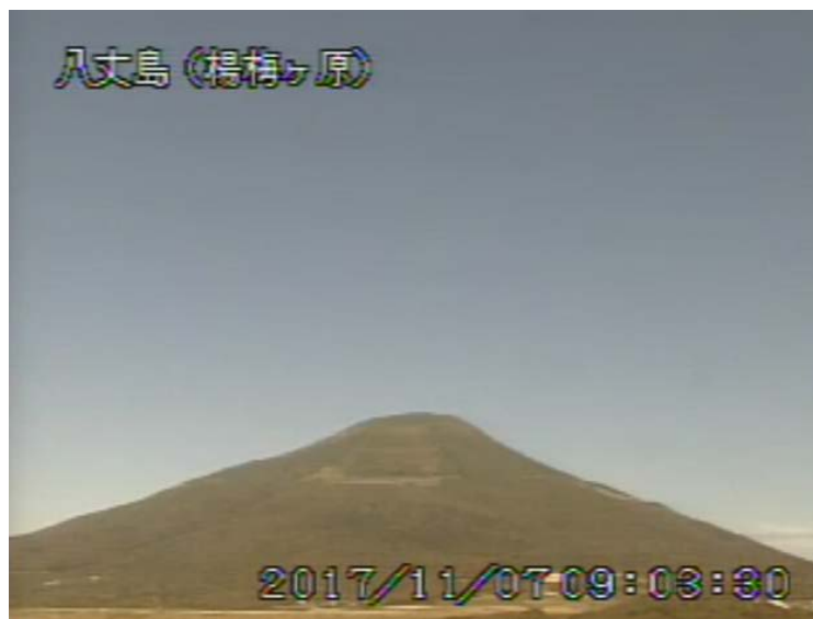
図 1 八丈島 西山山頂部の状況 (11 月 7 日 楊梅ヶ原 ようめがはら 監視カメラによる)

1) GNSS (Global Navigation Satellite Systems) とは、GPS をはじめとする衛星測位システム全般を示す呼称です。