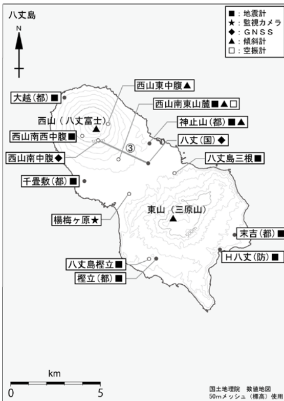
図4 八丈島 観測点配置図

・11月は、八丈島付近に震源が求まる高周波地震及び深部低周波地震はありませんでした。