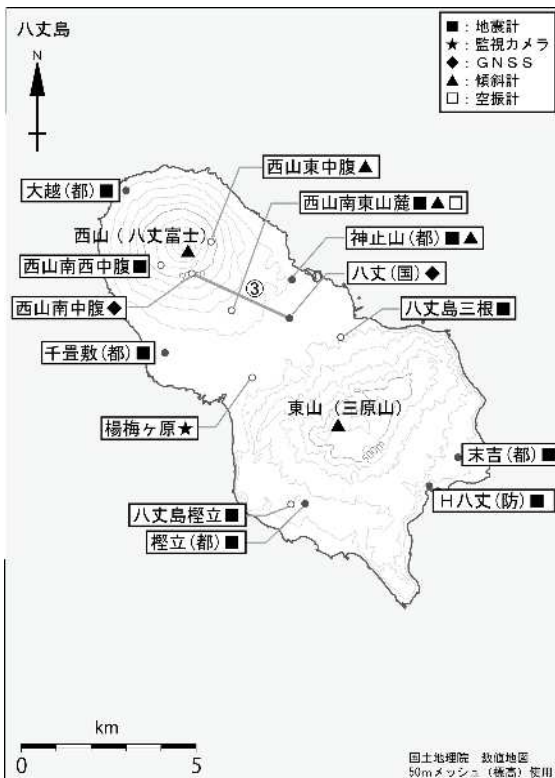
図4 八丈島 観測点配置図 GNSS基線 は図2の に対応しています。