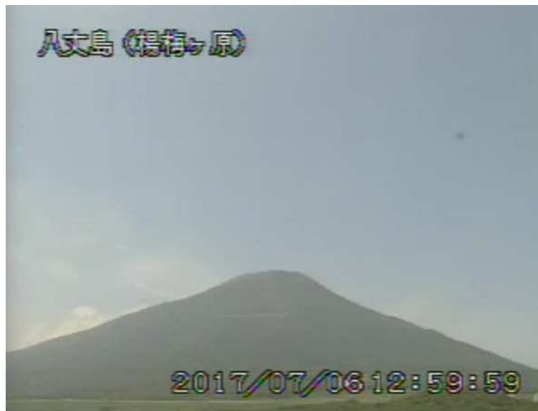
図 1 八丈島 西山山頂部の状況 (7月6日 楊梅ヶ原 ようめがはら 監視カメラによる)

1) GNSS (Global Navigation Satellite Systems) とは、GPS をはじめとする衛星測位システム全般を示す呼称です。