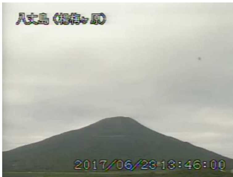
図 1 八丈島 西山山頂部の状況 (6月23日 楊梅ヶ原 ようめがはら 監視カメラによる)

1) GNSS (Global Navigation Satellite Systems) とは、GPS をはじめとする衛星測位システム全般を示す呼称です。