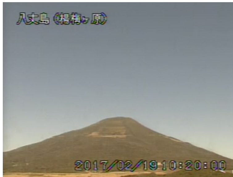
図 1 八丈島 西山山頂部の状況 (2月19日 楊梅ヶ原 ようめがはら 監視カメラによる)

1) GNSS (Global Navigation Satellite Systems) とは、GPS をはじめとする衛星測位システム全般を示す呼称です。