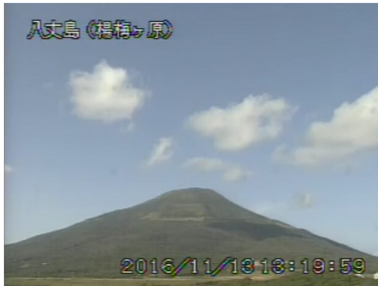
図 1 八丈島 西山山頂部の状況 (11 月 13 日 楊梅ヶ原 ようめがはら 遠望カメラによる)

1) GNSS (Global Navigation Satellite Systems) とは、GPS をはじめとする衛星測位システム全般を示す呼称です。