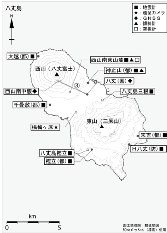
図4 八丈島 観測点配置図

・今期間、八丈島付近に震源が求まる高周波地震及び深部低周波地震はありませんでした。