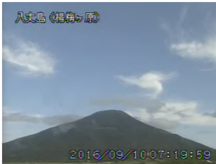
図 1 八丈島 西山山頂部の状況 (9月10日 楊梅ヶ原遠望カメラによる)

1) GNSS (Global Navigation Satellite Systems) とは、GPS をはじめとする衛星測位システム全般を示す呼称です。